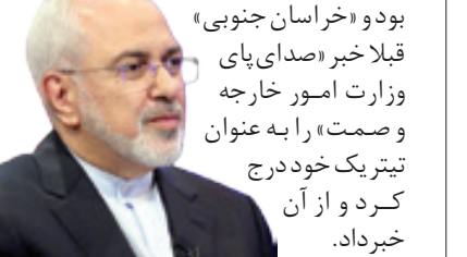
امیر امیرلوی، وزیر امور خارجه

اکبری – دستور ویژه ظرف به سفارتخانه های ایران در خصوص زرشک صادر شد و سفارتخانه ها در این خصوص ماموریت ویژه ای را گرفتند. وزیر امور خارجه دستور داد ویترین زرشک در همه سفارتخانه ها فعال شود و در این خصوص ورود ویژه داشته باشند. افزون بر این خبر، مدیر بازرگانی و توسعه تجارت سازمان صمت اعلام کرد: وزارت امور خارجه برای معرفی، بازاریابی و فروش زرشک و دیگر محصولات استراتژیک استان یا به رکاب شده و به همه سفیران ایران در دیگر کشورها ماموریت ویژه داده است. «بهشتی» ادامه داد: بنا به مضمون این نامه، همه سفیران اقتصادی در سفارتخانه ها برای معرفی زرشک باید اقدام کنند. به گفته او قرار است تمام قابلیت های استان در کنار دیگر قابلیت های ایران معرفی شود که زرشک یکی از ظرفیت های قابل معرفی است. بجران زرشک سوژه رسانه های استان در روزهای گذشته