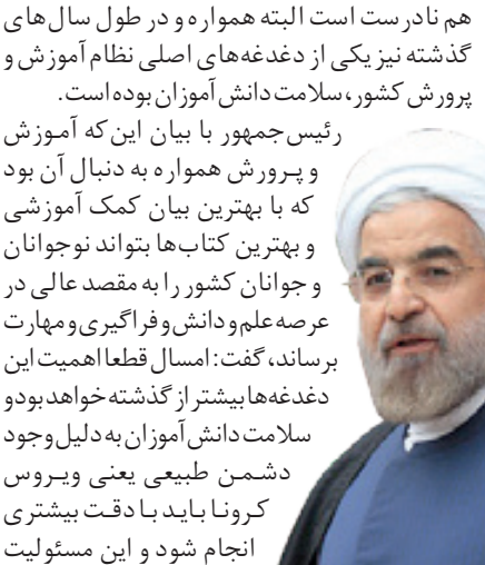
آیت الله العظمی آیت الله خامنه‌ای

کسی که معتقد است آموزش باید تعطیل شود یعنی پیشرفت، رشد و تعالی کشور متوقف شود