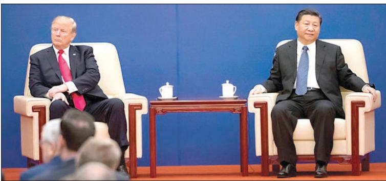
آمریکا به اتباع خود در باره احتمال بازداشت شدن در چین هشدار داد