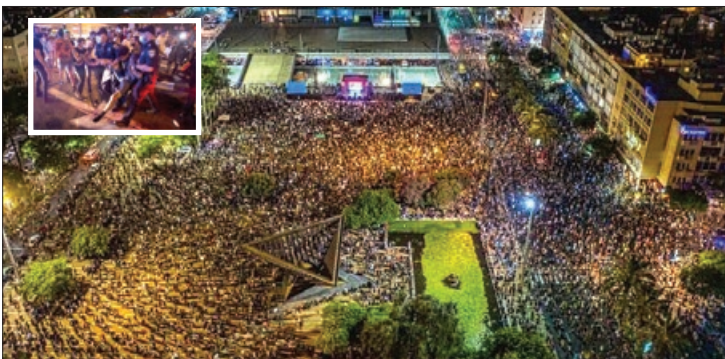
تظاهرات هزاران اسرائیلی علیه نتانیاهو به خشونت کشیده شد

حقوق بشر» تشدید شده است، واشنگتن به اتباع خود در این کشور نسبت به خطر فرآینده «بازداشت های خودسرانه» هشدار داد. وزارت