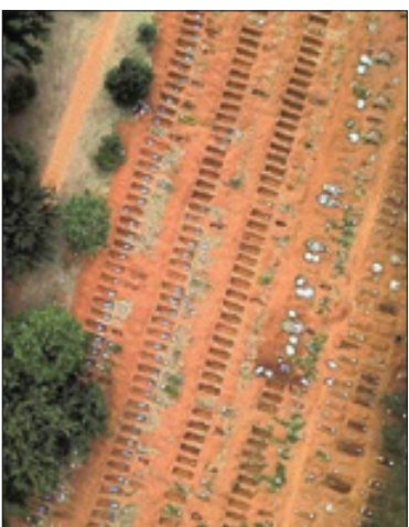
عکس روزنیز گورستانی در سائوپائولو از نشان می‌دهد.

این که لندن چگونه می خواهد از سال رکود و کساد۱ حاصل از برگزیت و البته کرونا سر بلند بیرون بیاید؟ میشل بارنیه، مسئول مذاکرات برگزیت از سوی اتحادیه اروپا در پایان سومین دور گفت‌وگوها میان نمایندگان اتحادیه و لندن روحیه جاه‌طلبی در میان هیئت مذاکره‌کننده بریتانیایی را مورد نکوهش قرار داد. او گفت که از گفت‌وگو در بسیاری از مسائل ناامید شده است و طرف بریتانیا باید واقع‌گرایی بیشتری از خود نشان دهد. در این زمینه، یک منبع نزدیک به مذاکرات نیز در پایان گفت‌وگوهای هفته جاری به خبرگزاری فرانسه گفته که به جز تغییر لحن و سخت‌تر شدن مواضع، هیچ اتفاق تازه‌ای در مذاکرات مشاهده نشده است. روزنامه «تاگس آنسایگر» سوئیس نیز در گزارشی نوشت: اتحادیه اروپا و انگلیس در مذاکرات پسابرگزیت درباره شراکت آینده پیشرفتی نداشتند و احتمال «خروج نامنظم» این کشور از بازار داخلی و اتحادیه گمرکی اتحادیه اروپا بیشتر می‌شود. لندن به‌طور رسمی به دنبال توافقی تجاری با اتحادیه اروپا مشابه کانادا و ژاپن است. این کشور در حقیقت می‌خواهد در حالی که عضوی از اتحادیه اروپا نیست، در بسیاری از زمینه‌ها وضع موجود و امتیازات خود در این اتحادیه را حفظ کند. اما، مسئول مذاکرات برگزیت از سوی اتحادیه اروپا می‌گوید خواهان توافق با بریتانیا است؛ البته نه