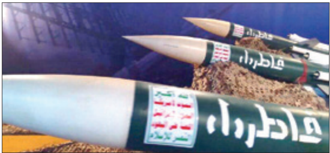
۲۸ جمادی الثانی ۱۴۴۱. شماره ۳۰۳۵

پدافند انصار... حملات جنگنده های سعودی-اماراتی به صنعا را دفع کرد