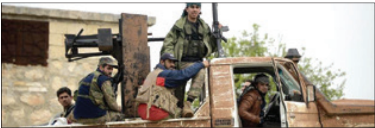
پس از تهدید اردوغان، عملیات عناصر وابسته به ترکیه در حلب آغاز شد

راحتی به خارج از کشور رفت و آمد کند. علاوی با انتشار یک فایل ویدئویی در فیس بوک خود، خواستار «تداوم تظاهرات تا زمان تحقق مطالبات و برگزاری انتخابات زود هنگام» شد. علاوی همچنین وعده داد دولتی را تشکیل خواهد داد که با مطالبات ملت عراق همچون گفت که «در نخست وزیر جدید عراق همچون گفت که «در راستای تعیین زمان انتخابات آینده» تلاش خواهد کرد. علاوی پس از سال ۲۰۰۳ دودوره