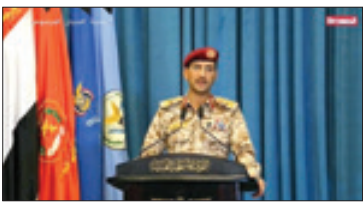
سرخنگوی ارتش یمن دستاوردهای عملیات نظامی «البنیان المرموص» را تشریح کرد

پرونده استیضاح رئیس جمهور آمریکا به مراحل حساسی رسیده است. پس از تصویب استیضاح ترامپ در مجلس نمایندگان و ارسال آن به مجلس سنا، جمهوری خواهان که در این مجلس اکثریت را دارند، به مانع تراشی در این زمینه پرداخته اند. آن ها برای پایان دادن به این پرونده و حرکت به سوی رای گیری نهایی عجله دارند. مجلس سنا جمعه شب با طرح احضار شاهدان برای ادای شهادت در جلسات دادگاه استیضاح ترامپ مخالفت کرد. این طرح با اختلاف کم ۵۱ رأی مخالف در برابر ۴۹ رأی موافق رد شد. به این ترتیب هیچ شهادی برای ادای شهادت در دادگاه استیضاح ترامپ حاضر نخواهد شد. بحث لزوم احضار شاهدان به ویژه «جان بولتون» مشاور امنیت ملی سابق آمریکا به دادگاه استیضاح ترامپ از زمانی داغ شد که در بخشی از کتاب در دست انتشار وی که نیویورک تایمز افشا کرد، مسئله فشا به او کرایه برای انجام تحقیقات علیه «هانتر بایدن» فرزند «جو بایدن» رقیب انتخاباتی ترامپ در سال ۲۰۲۰ مورد تاکید قرار گرفته است. به نظر می رسد اقدام هماهنگ سناتو ر های جمهوری خواه، جز دوفر از آن ها، در جلوگیری از احضار شهود به دادگاه استیضاح ترامپ با هدف حمایت از رئیس جمهور جنجالی آمریکادر مقابل افشاگری ها صورت گرفته است. به گفته «آدام شیف»، رئیس گروه دموکرات استیضاح کننده ترامپ، هر گونه مخالفت سناتو ر ها با حضور شاهدان بیشتر و ارائه اسناد جدید در جلسات استیضاح باعث شکل گیری بدعت نامناسبی در تاریخ آمریکا می شود و عواقب