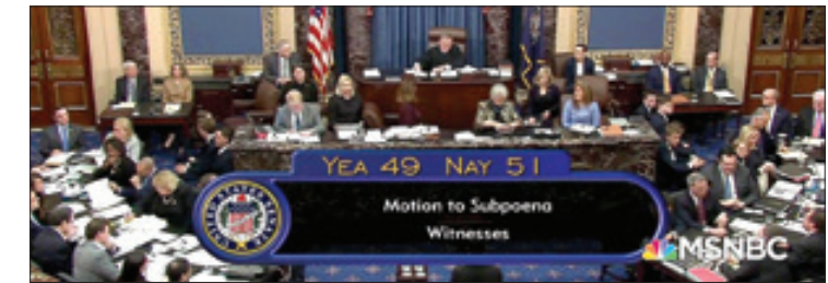
سنا طرح احضار شاهدان در پرونده استیضاح ترامپ را رد کرد