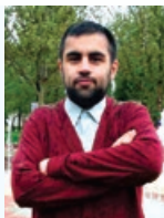
بازگشت همه به سوی اوست

پنجشنبه تاریخ ۹۸/۱۱/۳ از ساعت ۲:۳۰ الی ۴:۳۰ بعداز ظهر واقع در دارتبلغ حسینی تربت حیدریه واقع در خیابان کاشانی برگزار خواهد شد . حضور شما عزیزان مایه شادی روح آن مرحوم و تسلی خاطر بازماندگان خواهد بود .