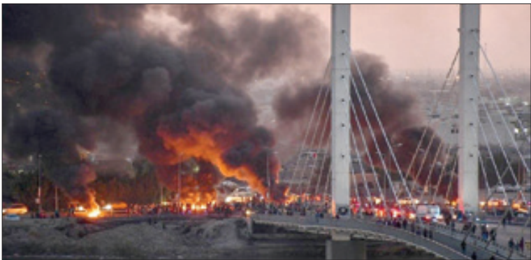
سه شنبه اول بهمن ۱۳۹۸ ۲۵ جمادی الاول ۱۴۴۱. شماره ۲۰۲۹۹

تلاش رسانه‌های آمریکایی و سعودی برای راه انداختن اعتراضات خشونت‌آمیز در عراق