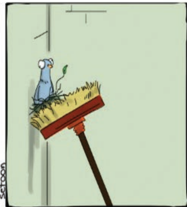
کار نویسند: صدیقه جعفریان