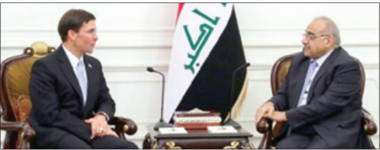
عبدالمهدی: نظامیان آمریکایی مجوزی برای ماندن در عراق نداشتند

سرزمین سر وها همچنان آرام و قرار ندارد. معترضان لبنانی در هفتمین روز تظاهرات مسالمت آمیز، خواستار اعتصاب عمومی در سراسر کشور شدند. آن ها همچنان میادین اصلی شهر ها را در دست دارند. در این میان، گروه ها و مجموعه هایی کوچک نیز در صدد سازمان دهی تظاهرات و هدایت اعتراضات به سوی اهداف و خواسته های معینی هستند. این خواسته ها عبارتند از، استعفای فوری دولت و تشکیل دولت نجات ملی، انحلال مجلس و برگزاری انتخابات طی نش ماه آینده و بازگرداندن اموال به سرعت رفته توسط سیاستمداران از سال