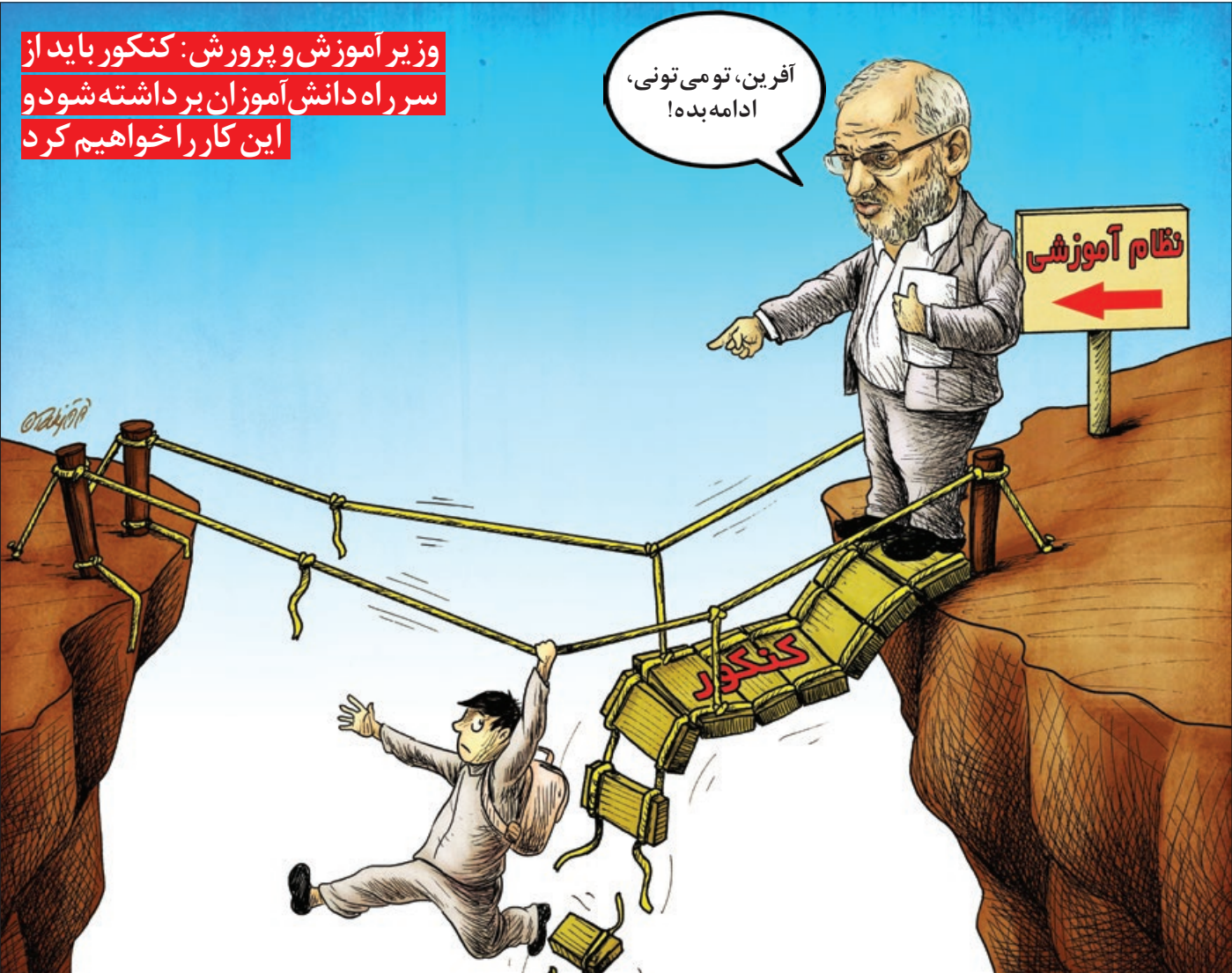
کار نویسند: خداداد کجکوب

وزیر آموزش و پرورش: کنکور باید از سر راه دانش آموزان برداشته شود و این کار را خواهیم کرد