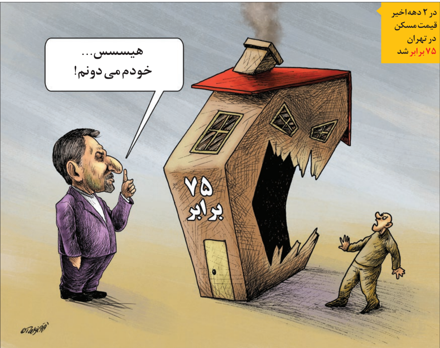
کار نویسیست: جواد نکجهو

در ۲ دهه اخیر قیمت مسکن در تهران ۷۵ برابر شد