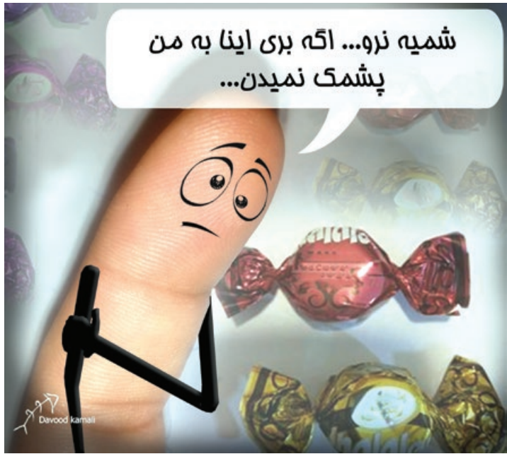
تصویرسازی: داوود کمالی

ایران رتبه اول جهان در کشف و ضبط مواد مخدر / تابناک کشف تریاک در پشیمک شکلاتی / اقتصاد آنلاین