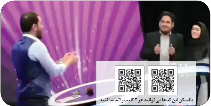
با اسکن این کدها می‌توانید هر ۲ کلیپ را تماشا کنید