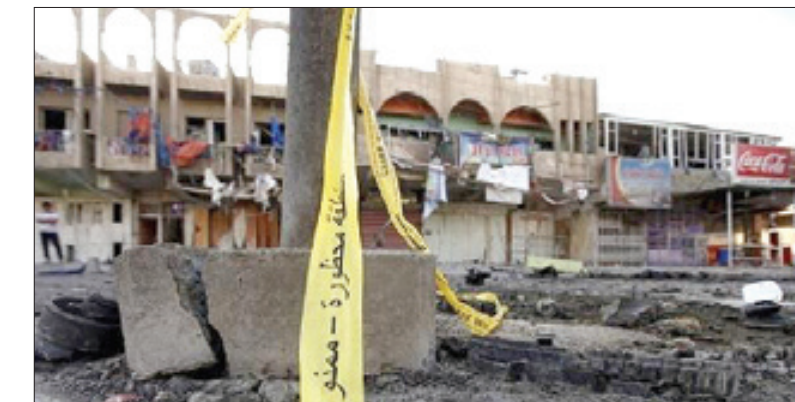
داعش مسئولیت انفجار در بغداد را به عهده گرفت

پرونده ادعای دخالت روسیه در انتخابات سال ۲۰۱۶ آمریکا باز هم خبر ساز شده و کنگره این کشور پسر بزرگ دونالد ترامپ را احضار کرده است. این برای اولین بار در تاریخ آمریکاست که کنگره از قدرت تحقیقات خود برای احضار حقوقی یکی از اعضای خانواده رئیس‌جمهور استفاده می‌کند. رابرت مولر، قاضی تحقیقات حاضر نشده است کمپین ۲۰۱۶ ترامپ را به توطئه و همدستی با روس‌ها برای پیروزی در انتخابات متهم کند.