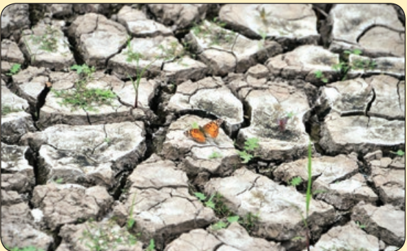
گاردین | خشکسالی در یکی از مخزن های آبی هندوراس

توضیح تردستی: برای انجام این شعبده باید آن قسمت جعبه کبریت را که آغشته به سنباده و فسفر است با قیچی از قوطی جدا کنید. سپس آن لایه نازک جدا شده را در یک ظرف بگذارید و روی دیگرش را با گرفتن فندک بسوزانید. پس از