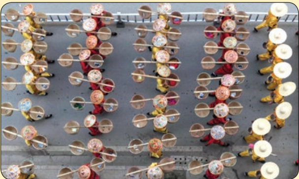
فرانس پرس ارژنه در خیابان های میانمار