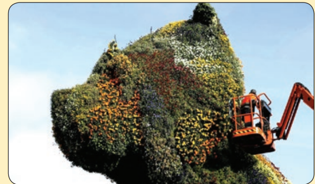
ای بی ای | گل آرایی مجسمه در یک نمایشگاه هنری، اسپانیا

• شماها یادتون نمیداد تلفن گویا که اومده بود یکی از تفریح های ما این بود ۱۱۹ رو می گرفتیم، ساعت و تاریخ گویا رو روی آیفون پخش می کرد، حس پیشرفته بودن بهمون دست می داد! • شنبه صبح زود بیدار شدن مثل این می مونه که سر بازیت تموم شده باشه ولی تو اضافه خدمت باشی، خسته ای ولی اگر بیدار نشی بازم اضافه خدمت می خوری! • به عکس هایی از بچگی تون نذارید که به جای «آخی چه ناز بودی» بگیم «ایول چه جراحی داشتی»! • به سوال، کسی تا حالا عروس دریایی رو قبل از عروسیش دیده؟! • کاشکی شنبه ساعت ۷ صبح وقتی بیدار می شدیم بهو بهمون می گفتن الان ۷ شب جمعه ست و شما می تونی ۱۲ ساعت دیگه بخوابی و این پروسه تا ابد ادامه داشت! • از به سنی به بعد هر چی بیشتر دنبال مقصر بگردی، بیشتر به خودت می رسی! • بیایید قول بدیم وقتی پیر شدیم، تو مترو بالای سر به جیوون که نشسته رو صندلی نایستیم! • هر مشکلی برام پیش میاد میگم عربی دبیرستان چه جوری گذشت؛ اینم می گذره!