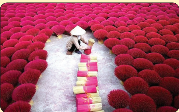
تلگراف | تولید ویسته بندی عود در هند

آن ها دوباره جریان را برای روزنامه ها شرح دادند اما همچنان دولت و حتی خلبان مد نظر هیچ جواب قانع کننده ای برای این اتفاق نداشتند و همه ماجرا را منکر می شدند. این داستان با وجود تلاش زیاد رسانه ها و یوفو لوژیست ها هرگز به نتیجه ای نرسید. آیا دولت آمریکا از وجود آن شیء باخبر بوده یا آن شیء یک وسیله سری ارتش بوده است یا یک سفینه فضایی؟ منبع: blueblurrylines