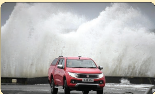
توفان با سرعت ۱۱۲ کیلومتر بر ساعت در انگلستان

پاهای تاول زده ام واژه های عبور را از یاد برده اند!