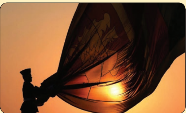
افسر نیروی هوایی سری لانکا و پرچم این کشور

تاو ل های زیاد روی پوست شان پدید آمد و به دلیل حالت تهوع شدید مدتی در بیمارستان بستری شدند. برای مدتی موهای سر و ناخن هایشان ریخت و این عوارض برای چندین سال ادامه داشت و باعث شد آن ها بیش از ۲۰ بار در بیمارستان بستری شوند. آن دو خانم ماجرا را برای پلیس شرح دادند ولی هیچ کس توضیحی برای آن نداشت. تا مدتی در رسانه ها خاطره خود را بازگو می کردند و علیه دولت فدرال شکایت و درخواست غرامت کردند. تااین که چند سال بعد در نمایشگاه هوایی، خلبانی عملکرد بالگرد را توضیح می داد. این دوزن هم به نمایشگاه رفته بودند که خلبان توضیح داد سال ها پیش یک یوفور اتعقیب کرده است. آن دو از او تاریخ و مکان دقیق را پرسیدند و متوجه شدند که دقیقاً با خاطره خودشان مطابقت دارد. به خلبان گفتند آن ها نیز آن شب در محل حضور داشتند و شاهد این پدیده بودند. خلبان بعد از شنیدن این حرف ها سکوت کرد و هیچ توضیح اضافه دیگری نداد.