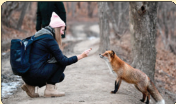
تاس | غذا دادن به روباه گرسنه ای که بر اثر سرما به آدم ها پناه آورده، جزایر راسکی

• شهر داری عکس یک آدم ویلچری زده و روی بیلپور د نوشته: «استفاده از امکانات شهری حق همه است.» انگار مثلاً همه جا واسه ویلچری ها امکانات شهری ساختن ولی ما با نانچیکو و ایسادییم نمی داریم استفاده کنن! • تولید کننده محترم، یک طوری تولید کن که انگار می خوامی ببری خونه خودت، نه این که بکنی تو پاچه ما دویله پولش رو بگیری! • یکی رو داشتیم تو دانشگاه ۱۴-۱۳ ترم داشت می خوند. روز دانشجو مثل شب یلدا بچه ها رو جمع می کرد دور خودش و از قدیما براشون خاطره می گفت! • دوستان استقلال ایی ۵ تا گل که زمین دیدید چقد حال داد؟ ما ۶ تا شو بهتون زدیم! • می دونستین ما هی که حقوق بخونه میشه چی؟! میشه فیش حقوقی... هار هار هار! • بابابزرگم خدایا مریک لیوان داشت مخصوص چای، این قدر گنده بود که هر دفعه توش چای می خور د پول قبض آب خونه دو برابر می اومد. یک بار هم از سازمان آب اومدن به عنوان مشترک پر مصرف انشعاب مون رو قطع کردن!