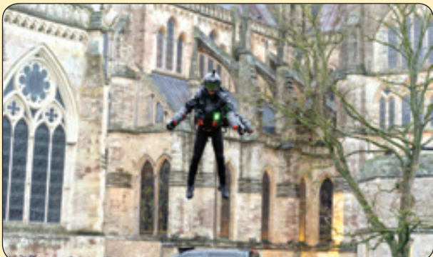
تلگراف | نمایش دستگاه پرواز شخصی توسط مخترعش در همایش علمی، انگلستان

پنجره ای شدم در پس پرده باران شیشه ای از بخار کدر شده و هیچ چیز از پشت پنجره پیدانیست