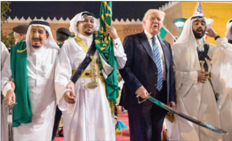
ترامپ و ملک سلمان در حال رقص شمشیر در عربستان

«پیمان کوئینسی» در واقع مجوز رسمی ورود آمریکایی‌ها به مسائل داخلی عربستان است؛ آن‌ها می‌توانند به بهانه حفظ رژیم سعودی، هر زمان که صلاح بدانند، در امور داخلی عربستان دخالت کنند؛ هر چند که برخی تحلیلگران سیاسی با استناد به مفاد پیمان، آمریکار ا از اتهام