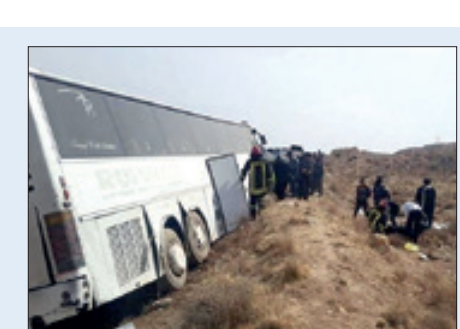
مهمل در استان تهران

سرهنگ کارگاه احمد نجفی، معاون مبارزه با سرقت‌های خاص پلیس آگاهی تهران بزرگ، با اعلام این خبر گفت: با توجه به اعتراف صریح متهمان به ده‌ها فقره سرقت و اخاذی به شیوه ایجاد تصادف ساختگی، سوابق متهمان در اجرای جرایم مختلف به ویژه در انجام سرقت‌های مشابه، شناسایی ده‌ها مال باخته در همان مراحل اولیه تحقیقات و به منظور شناسایی دیگر شکات پرونده، هماهنگی‌های لازم با مقام قضایی برای انتشار بدون پوشش تصاویر این گروه ۱۱ نفره از سارقان انجام شده است؛ بنابراین از کلیه شکات و مال باختگان که موفق به شناسایی متهمان شدند دعوت می‌شود تا برای طرح و پیگیری شکایات خود به نشانی اداره پنجم پلیس آگاهی تهران بزرگ در خیابان وحدت اسلامی مراجعه کنند.