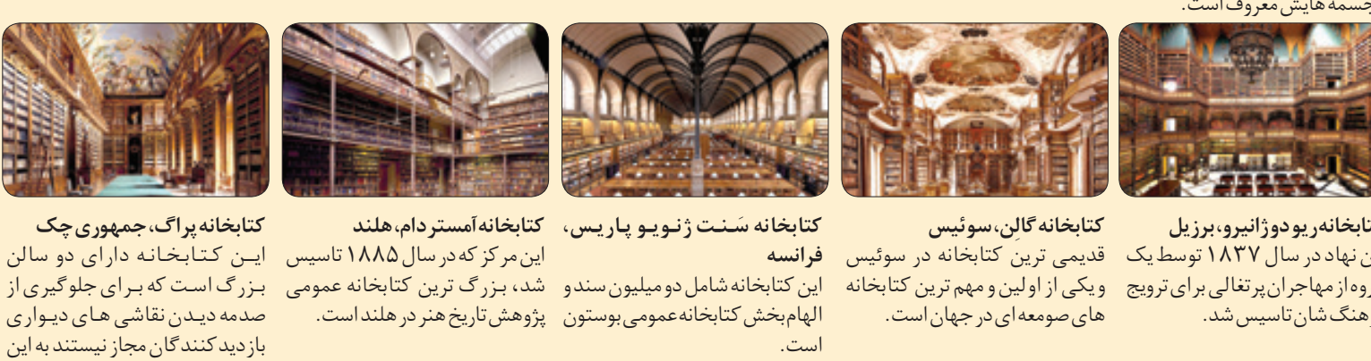
کتابخانه آدامسون، سوئیس