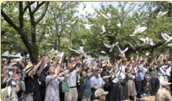
پرواز دادن کبوترهای سفید به مناسبت سالگرد پایان جنگ جهانی دوم، ژاپن