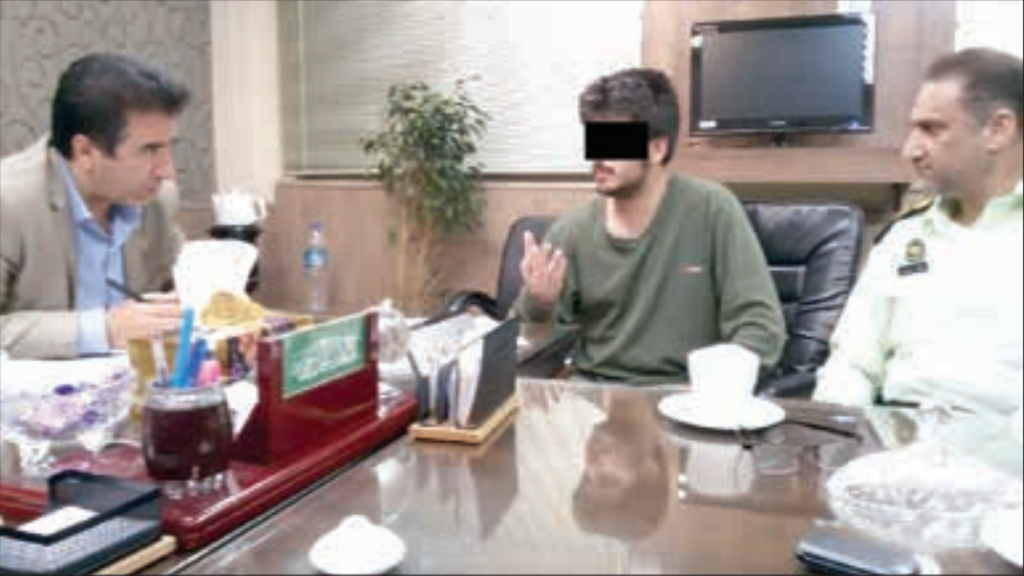
تیرانداخت قاتل مارمولک‌نشان قاضی بعد از دستگیری در حضور بازرس مرئی

گزارش خراسان حاکی است: در پی اعتراضات صریح متهم ودوبار بازسازی صحنه قتل، کیفرخواست این پرونده جنیم در دادرسی مشهد صادر و این پرونده در شعبه پنجم دادگاه کیفری یک خراسان رضوی توسط قاضی بنده و به مستشاری قاضی شجاع پور فدکی رسیدگی شد. قضات دادگاه پس از برگزاری چندین جلسه محاکمه که با حضور وکلای مدافع متهم برگزار شد، با توجه به دلایل و مدارک مستند و همچنین نظریه پزشکی قانونی، رای به قصاص نفس در ملاء عام دادند. همچنین متهم به خاطر جرایم دیگر مانند آدم ربایی به تحمل زندان طولانی مدت و اشد مجازات‌های قانونی محکوم شده‌است.