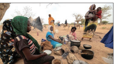
آوارگان جنگ داخلی سودان در کشور همسایه چاد