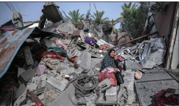
حملات هوایی اسرائیل به غزه