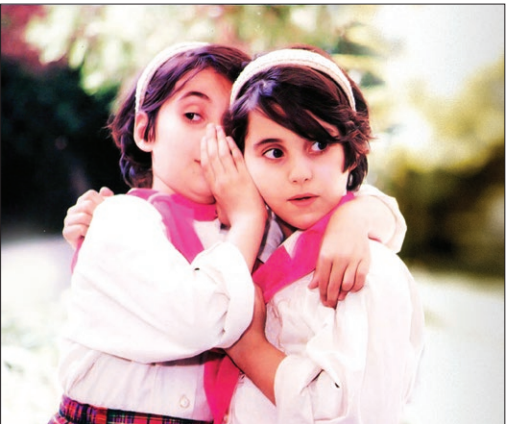
فیلم از «خواهران غریب»