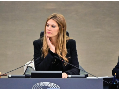
رئیس پارلمان اروپا از ضرورت بررسی بیشتر پیشنهاد لئورواید اتحادیه اروپا برای شهروندان قطر خبر داد.

همین زمینه وکیل خانم کایلی در نخستین واکنش پس از متهم شدن موکلش به دریافت رشوه، اعلام کرد که او بی گناه است و «هیچ ارتباطی» با رشوه هایی که «قطر» میزبان جام جهانی به سیاستمداران اتحادیه اروپا داده بود، ندارد. بنا به گفته دادستان بلژیک، ۶۰۰ هزار یورو در خانه یکی از مظنونان، ۱۵۰ هزار یورو در آپارتمان متعلق به یک نماینده پارلمان اروپا و چند صد هزار یورو در یک چمدان در اتاق هتلی کشف و ضبط شده است. خبرگزاری فرانسه به نقل از منبع قضایی خود در بلژیک نوشت: بازرسان بر این باورند که افرادی از قطر با هدف تحت سلطه در آوردن سیاست گذاری ها در پارلمان