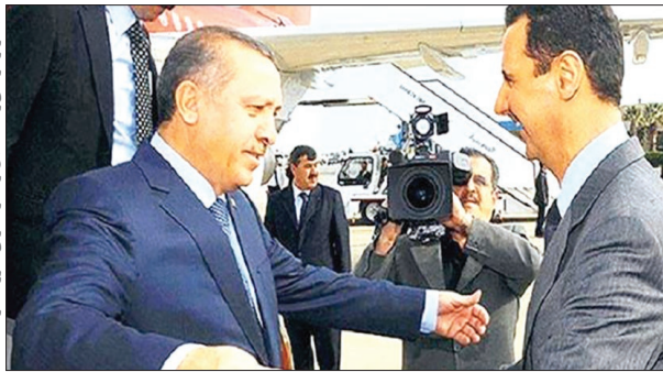
دیدار اردوغان و اسد قبل از آغاز دیدار با اسد در تهران (سوریه ۲۰۱۱)

پناهجویان سوری به قیمت کاهش رای او تمام می شود. از تابستان گذشته که درگیری های خونین آمیزی بین ترک ها و جامعه آوارگان سوری به وقوع پیوسته است، اردوغان تلاش کرده است تا یک چرخش را در سیاست هایش به نمایش بگذارد. به تازگی اردوغان از طرحی برای بازگرداندن یک میلیون پناهجوی سوری به کشورشان رونمایی کرد، برخی از سیاسیون نیز به این نگرانی که حمله ترکیه به دمشق هماهنگ خواهند شد. نیروهای ارتش سوریه و متحدانش هم اکنون در اطراف منبج و تل رفعت مستقر هستند و آماده دستور دفاع از سوی بشار اسد تا با ترک ها و تروریست های تحت امرشان درگیر شوند. بنابراین زمین بازی به هیچ وجه برای اردوغان امن نیست و می تواند در صورت شکست و تلفات زیاد سقوطش را تسریع کند. در این شرایط که هزینه ترین گزینه جلب همکاری دمشق است و پوستنی که بالاخره گذرش به دباغ خانه افتاده است.