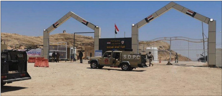
سختگوی فرمانده کل نیروهای مسلح عراق: نیروهای مرزبانی عراق در مرزهای ایران و ترکیه به سرعت مستقر می شوند

سر روابط تجاری مشکوک هانتز بایدن با مقام های اوکرینی و چینی در اکتبر ۲۰۲۰ نخست توسط همین روزنامه آمریکایی رسانه ای شد. در این میان، شخص رئیس جمهور اگر چه بارها صحبت درباره این ادعاها را رد کرده، اما اطلاعات به دست آمده از لپ تاپ هانتز بایدن گفته های پدر را مورد تردید قرار داده است؛ دو همکار سابق هانتز ادعا کرده اند که بر اساس ایمیلی که در لپ تاپ وی پیدا شده، به یک «مرد