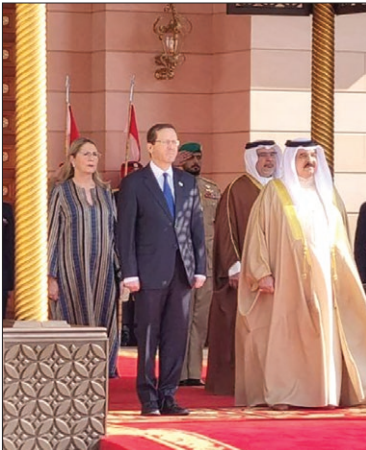
رئیس رژیم صهیونیستی، به عنوان نخستین مقام ارشد اسرائیلی به یحیرن سفر کرد

دونالد ترامپ تنها رئیس جمهور در تاریخ آمریکا که دو دادگاه استیضاح در کارنامه دارد و به اتهام تحریک هوادارانش برای حمله به ساختمان کنگره و اقدام تروریستی ۶۶ ژنویه باید در دادگاه پاسخگو باشد، اکنون خواستار کنار گذاشتن قانون اساسی آمریکا شد. شبکه خبری سی ان ان با انتشار این خبر افزود: ترامپ در شبکه اجتماعی خود موسوم به «تروث» با اصرار بر تئوری توطئه در انتخابات ریاست جمهوری ۲۰۲۰، خواستار خاتمه دادن به قانون اساسی آمریکا برای ملغی ساختن نتیجه این انتخابات و بازگشت دوباره به قدرت به عنوان رئیس جمهور شد. ترامپ در این باره نوشت: (آیا) حاضر هستید) نتایج انتخابات ۲۰۲۰ را دور بریزید و برنده حقیقی را اعلام کنید یا انتخابات جدید (برگزار شود)؛ تقلبی بزرگ در چنین ابعادی این امر را مجاز می سازد تا هر چه قوانین و مقررات و حتی آن چه که در قانون اساسی (آمریکا) یافت می شود، خاتمه داده و کنار گذاشته شود. رئیس جمهور سابق و جنجالی آمریکا، شرکت