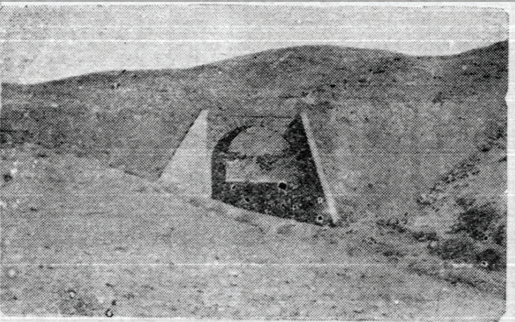
يكی از پلهای بزرگ درسنگ بست