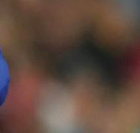
لیدر تیم ملی در دیدار دوستانه با اسپانیا

گروه ورزش / جرارد پیکه کاپیتان بارسلونا که این فصل شرایط خوبی در نیوکمپ نداشت و به مهره چهارم ژاوی برای خط دفاع تبدیل شده بود پنج شنبه شب به صورت غیرمنتظره از بارسلونا خدا حافظی کرد و شوک بزرگی به هواداران بارسا و فوتبال دوستان و تیم ملی اسپانیا وارد کرد. پیکه که از سال ۲۰۰۸ با بارسا قرار داد بسته و تا امروز برای آبی اناری‌های ایالت کاتالان بازی کرده است و یکی از اسطوره‌های این تیم پرافتخار اسپانیایی است، پنج شنبه شب با انتشار ویدئویی از خود در توئیتر خدا حافظی اش را از بارسا و دنیای فوتبال اعلام کرد. او خطاب به هواداران بارسا گفت: «شما هواداران بارسا به من همه چیز را دادید و رویای کودکی‌ام را به واقعیت تبدیل کردید؛ الان وقت آن رسیده که به این بخش از حرفه‌ام پایان دهم. همیشه گفته بودم که بعد از بارسا