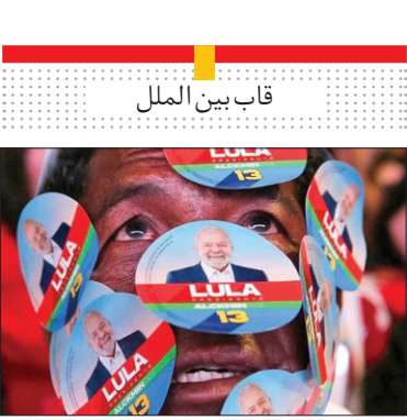
قاب بین الملل

سخنرانی باراک اوباما رئیس جمهور سابق آمریکا در کارزار انتخاباتی یک سناتور دموکرات در شهر آتلانتا برای انتخابات میان دوره ای کنگره آمریکا