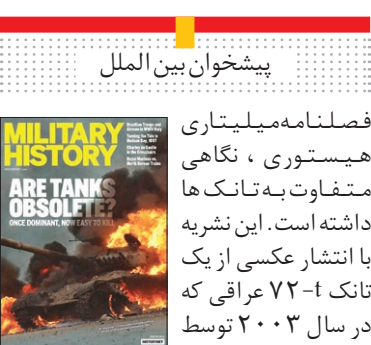
پیشخوان بین الملل

فصلنامه میلیتاری هیستوری، نگاهی متفاوت به تانک ها داشته است. این نشریه با انتشار عکسی از یک تانک ۷۲-۱ عراقی که در سال ۲۰۰۳ توسط یک موشک ضد تانک قابل حمل هدف قرار گرفت و با انتخاب تیتز «آیا تانک ها منسوخ شده اند؟» کاربرد کنونی تانک ها در جنگ ها را بازبینی کرده است. این نشریه می گوید، زمانی تانک ها اصلی ترین حرف را در میدان های نبرد می زدند، اما با ورود فناوری های پیشرفته ضد تانک، اکنون به راحتی در جنگ ها از بین می روند.