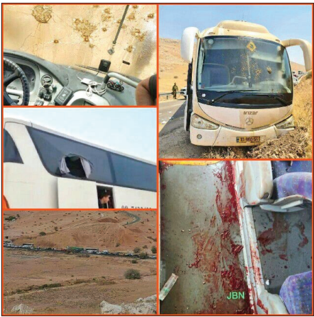
حمله به اتوبوس نظامیان صهیونیست در دره اردن، دست کم ۱۲ زخمی به جا گذاشت

با ادامه حمایت کشور های اروپایی از اوکراین و تاثیر جنگ اوکراین بر زندگی شهروندان اروپایی، اعتراضات اجتماعی در برخی از کشور های اروپا شدت گرفته است. این حمایت ها، هزاران تن از ساکنان پایتخت چک را به خیابان کشاند تا علیه دولت لیبرال-محافظه کار شعار بدهند و خواستار خروج این کشور از اتحادیه اروپا و ناتو شوند. «چک در اولویت نخست قرار دارد»، «نمی خواهیم به خاطر اوکراین یخ بزنیم و از گرسنگی بمیریم! او... از جمله شعار های آن ها بود. سازمان دهندگان تظاهرات در پراگ که بیش از ۷۰ هزار نفر تخمین زده می شدند، اعلام کردند جمهوری چک باید از نظر نظامی بی