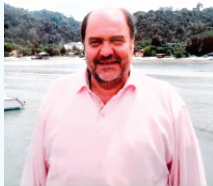
هشتمین سالگرد مهربانترین فرد زندگیمان شادروان