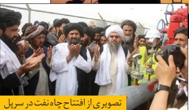
تصویری از افتتاح چاه نفت در سرپل

تابی چاه نفت است که همزمان با افتتاح آن استخراج گاز و نفت از ۹ چاه دیگر