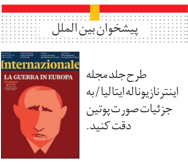
طرح جلد مجله