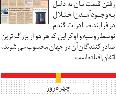
فایننشیال تایمز در

گزارشی به رکورد شکنی قیمت نان در بازارهای جهانی می پردازد. این بالا رفتن قیمت نان به دلیل به وجود آمدن اختلال در فرایند صادرات گندم