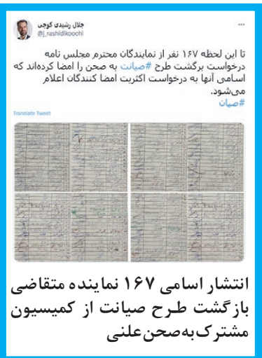
انتشار اسامی ۱۶۷ نماینده متقاضی بازگشت طرح صیانت از کمیسیون مشترک به صحن علنی