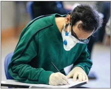
آزمون دکترای نیمه متمرکز، روز گذشته با حضور بیش از ۱۸۶ هزار داوطلب در سراسر کشور برگزار شد