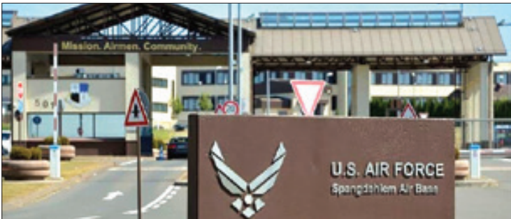
گروه بلینگ کت: سربازان آمریکایی در جریان مرور آنلاین دانش خود، اسرار هسته ای را افاش کرده اند

فلسطینی و باز خورد های آن، حالاً نفتالی بنت تصمیم گرفته دست یابتر لاپید، رقیب فعلی نخست وزیر اسرائیل را برای تشکیل دولت فشار داد. اما این تصمیم یک شبه هم گرفته نشد. نفتالی بنت، رهبر حزب «یمینا» پیشتر به بنیامین نتانیاها پیشنهاد داده بود که در صورت تشکیل دولت ائتلافی، سال نخست او نخست وزیر باشد. اما نتانیاها گفته بود در خواست نفتالی بنت به عنوان رهبر حزبی که تنها هفت کرسی از مجموع ۱۲۰ کرسی کنگست را به دست آورده، غیر عادی است، با این حال، نتانیاها تأکید کرده بود که برای جلوگیری از تشکیل دولتی چپ گرا حاضر است این خواسته را بپذیرد. توافقی که به دلیل جنگ اخیر روی هوا رفت. حالا شبکه ۱۲ تلویزیون رژیم صهیونیستی به نقل از منابع آگاه اعلام کرده که نفتالی بنت با موضوع تشکیل دولت «تغییر» یا یابتر لاپید رهبر حزب «آینده ای هست» که هدف آن جایگزینی دولت فعلی به ریاست بنیامین نتانیاهاست، موافقت کرده و انتظار می رود