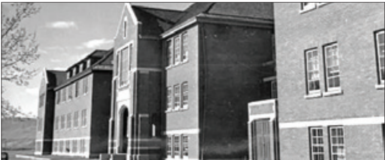
جنازه ۲۱۵ کودک بومی در یک گور جمعی در یکی از مدارس شبانه روزی قدیمی کانادا کشف شد

گزارش ها از توافق لاپید و بنت برای تشکیل کابینه ائتلافی حکایت دارد. در صورت تشکیل شدن این کابینه، بنیامین نتانیاها پس از ۱۲ سال قدرت را از دست خواهد داد رژیم در جنگ ۱۲ روزه با گروه های مقاومت