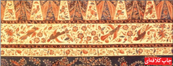
چاپ کلافه ای