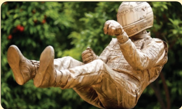
مجسمه یادمان یک‌راننده فوت‌شده مسابقات اتومبیل‌رانی فرمول یک، اسپانیا