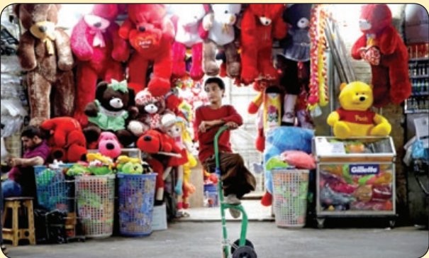
استراحت باربر جوان‌روی چرخش در بازار تهران

• نیم ساعت پیش به خودم گفتم امروز خیلی دراز کشیدم، برم یکم راه برم وزدم بیرون. فقط نمی‌دونم چرا الان رو چمن‌های پارک خوابیدم! • اعتراف می‌کنم سال‌های بین کودکی تا نوجوانی من با این سوال هدر رفت که خود بامیه به این خوشمزگی پس چرا خورش بامیه این قدر بدمزه‌ست و از اون بدتر چرا خورشش اصلاً بامیه نداره؟! • نقاشه اومده بود خونه مون رنگ آبی رو نشون می‌داد می‌گفت این سبز تیره رو بزنم خیلی قشنگ میشه. قشنگ مثل اینه که بری چشم‌پزشکی، دکتره چشماش ۱۰ نمره ضعیف باشه!