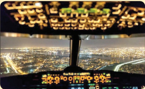
نشنال جئوگرافیک| روشنائی‌های آسمان

بی‌بی‌سی – روستایی به نام «پلوگستل» در فرانسه، دو هزار یورو جایزه برای رمزگشایی کتیبه‌ای ۲۳۰ ساله که روی سنگی یک متری در ساحلی دورافتاده حک شده، تعیین کرده است. تاکنون هیچ‌کس نتوانسته مفهوم ۲۰ خط نوشته شده‌این کتیبه را که چندسال پیش پیدا شده است، کشف کند. این سنگ نوشته فقط در حالت جزر دریا دیده‌می‌شود. در میان حروف به کار رفته در این کتیبه، حروف الفبای فرانسوی و اسکاندیناویایی هم دیده‌می‌شود که برعکس نوشته شده‌اند. روی این کتیبه دو تاریخ ۱۷۸۶ و ۱۷۸۷ وجود دارد که نشان می‌دهد این کتیبه باید متعلق به چندسال پیش از انقلاب کبیر فرانسه باشد.