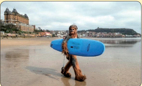
موج سواری یک طرفدار فیلم های جنگ ستارگان، انگلستان

در آستین مرقع پیاله پنهان کن که همچو چشم صراحی ز مانه خون ریز است به آب دیده بشویم خر قه ها از می که موسم ورع و روزگار پریز است