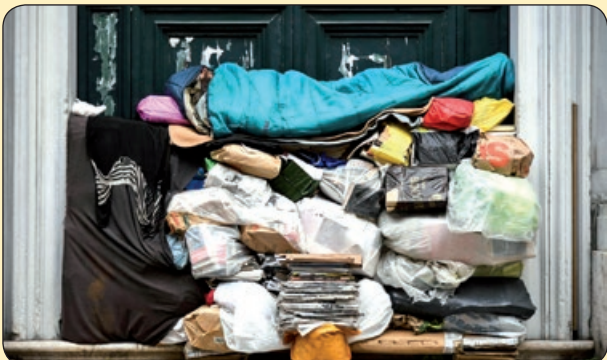
خواب خوش یک بی خانمان روی دسترنج روزه اش، ایتالیا