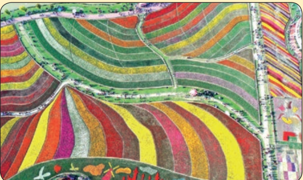
گاردین | جشنواره گل ها با ۳ هزار گل لاله، چین