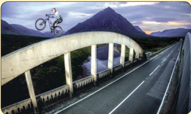
تلگراف | هنر نمایی یک بد لکار بالای نه های پل، اسکاتلند

و سر آغاز زمان خنده ناز و چشم تو به این گمشده بی بُعد است