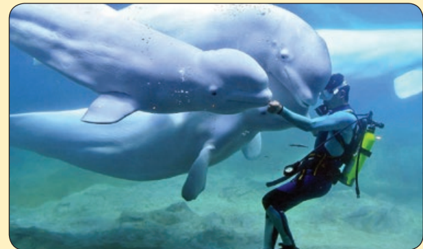
شینها | بازی دلفین ها با مربی شان، چین