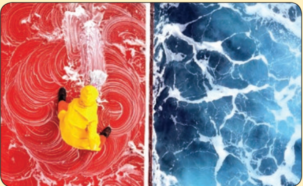
سالنت نیوز | ملوانی در حال تمیز کردن عرشه کشتی روی اقیانوس اطلس

در خلاف آمد عادت بطلب کام که من کسب جمعیت از آن زلف پریشان کردم نقش مستوری و مستی نه به دست من و توست آن چه سلطان ازل گفت بکن آن کردم