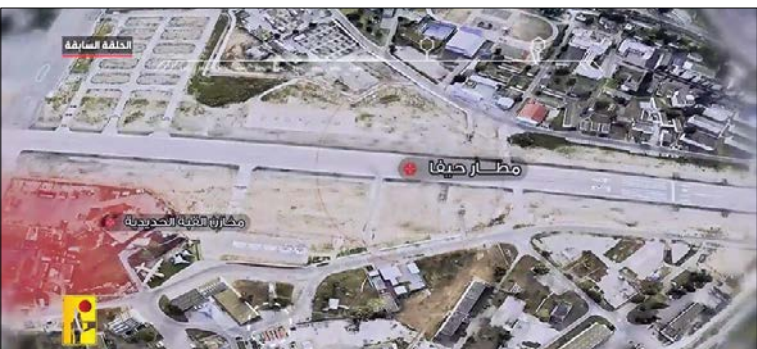
پهپادهای حزب... تصاویر مهمی از تاسیسات حیاتی رژیم صهیونیستی در منطقه