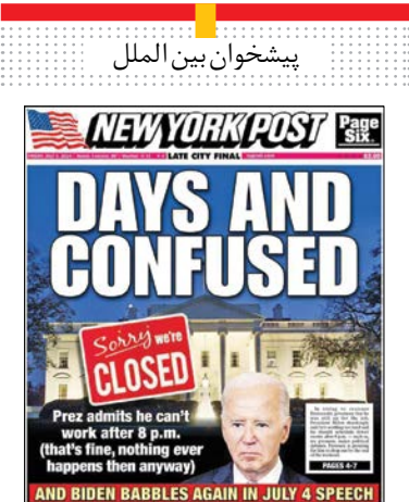
پیشخوان بین الملل

در برابر بازگشت گیک کهنه ترامپ است که اولین دوره ریاست جمهوری خود را با سرزنش متحدان ناتو گذراند و با لادیمیر پوتین، رئیس جمهور روسیه ارتباط صمیمانه برقرار کرد. ترامپ گفته است اگر فکر کند که یک کشور عضو ناتو دستور العمل های هزینه های دفاعی ائتلاف را رعایت نکرده است، به اصل دفاع متقابل ماده ۵ ناتو پایبند نخواهد بود. سی ان ان در پایان پس از برشمردن چالش های پیش روی بایدن در نشست آتی ناتو که تنها به دلیل افزایش سن او در برابر سایر سران ائتلاف است که اغلب بسیار جوان تر از او هستند، تصریح کرد: بایدن از زمان آغاز جنگ روسیه و اوکراین در فوریه ۲۰۲۲، راهنمای ثابت قدم برای ناتو بوده و بقای دموکراسی جهانی را سنگ بنای ریاست جمهوری خود قرار داده است. اما او در نشست این هفته اولویت بسیار فوری تری دارد؛ نجات خود.