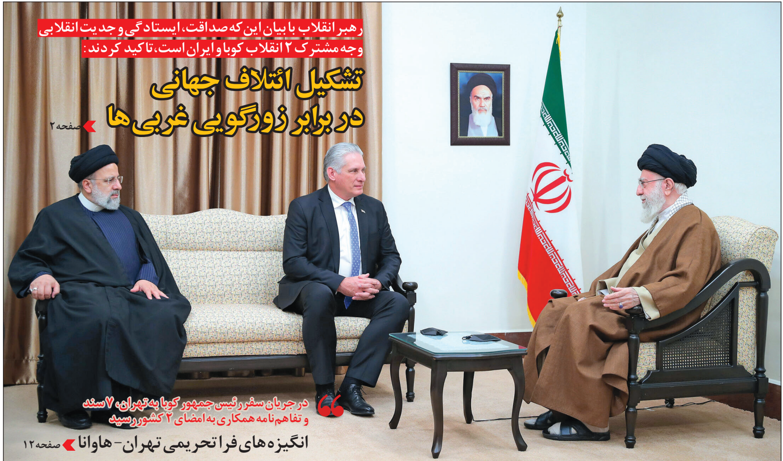
رہبر انقلاب با بیان این که صداقت، ایستادگی و جدیت انقلابی وجه مشترک ۲ انقلاب کوئاب و ایران است، تاکید کردند: تشکیل ائتلاف جهانی در برابر زورگویی غربی‌ها در جریان سفر رئیس‌جمهور کوئاب به تهران، ۷ سند و تفاهم‌نامه همکاری به امضای ۲ کشور رسید انگیزه‌های فراطحریمی تهران - هاوانا