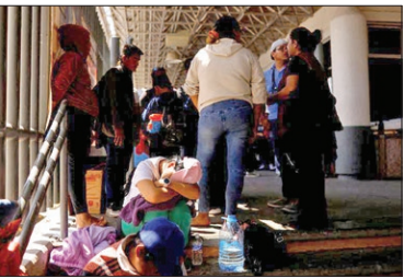
قاب بین الملل

تجمع پناهجویان در مرز مکزیک و آمریکا هم‌زمان با انقضای بند قانونی محدودیت کرونایی برای ورود پناهجویان به خاک آمریکا