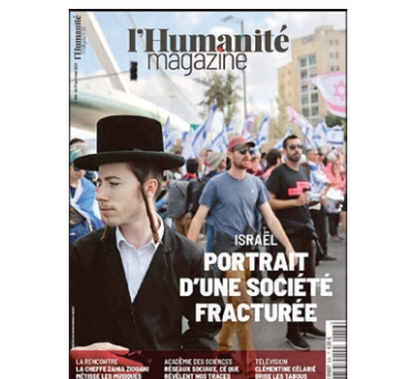
پیشخوان بین الملل

تیتز هفته نامه فرانسوی «لومانیته مگزین» «اسرائیل: تصویر یک جامعه از هم پاشیده» لومانیته مگزین، ضمیمه هفتگی برای روزنامه لومانیته است که پنج شنبه‌ها منتشر می‌شود و مدیر هر دو نشریه یکی است اما کارکنان تحریریه آن‌ها متفاوت است.