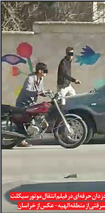
دزدان حرفه‌ای در فیلم انتقال موتور سیکلت سرقتی از منطقه‌الهیة

هم آن ها را شناختند چرا که دو سارق یاد شده در محله شهرک صابر بسیار مشهور بودند. این گونه بود که راز سرقت یک گوشی تلفن و یک دستگاه موتورسیکلت