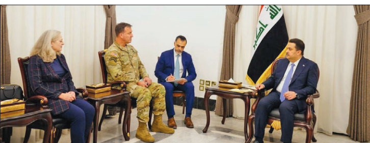
عکس از نشست ویدئو دیدار سفیر آمریکا و فرمانده مستشاران ایستاد در عراق

زمزمه‌هایی به گوش می‌رسد که به زودی تحریم‌های شدیدی از سوی آمریکا بر بانک‌های عراق در پی بحران دلار در این کشور اعمال خواهد شد. هر چند وزیر دارایی عراق آن را تکذیب می‌کند