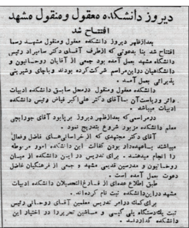
خبر افتتاح دانشکده الهیات دانشگاه مشهد صفحه اول روزنامه خراسان مورخ ۲۳ آذر ۱۳۳۷