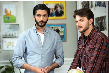
از سرنوشت ۴