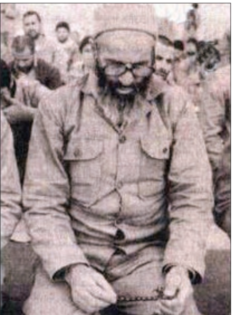
علامه حسن زاده هنگام حضور در جبهه‌ها با لباس سربازی

شرحی از زندگی منحصر به فرد علامه حسن زاده آملی