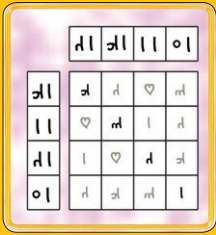
စာနာစာနာ: