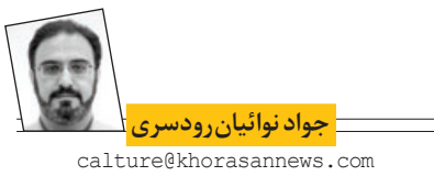
جواد نوائیان رودسری