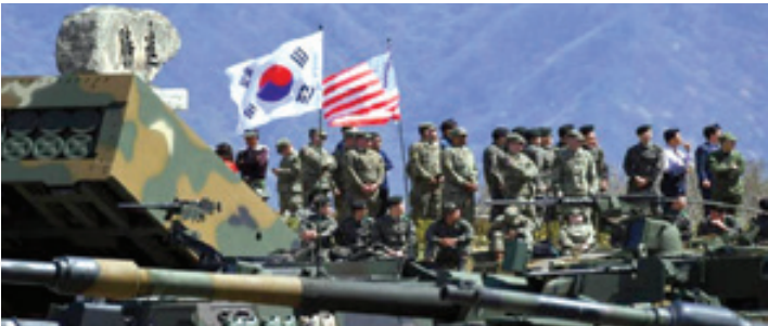
آغاز دور جدید مذاکرات واشنگتن - سئول برای افزایش سهم پرداختی حضور نظامیان آمریکایی

گروه بین الملل – رئیس جمهور آمریکا در جشن کریسمس که در کاخ سفید برگزار شد، برای شرکت در رقابت های انتخاباتی ۲۰۲۴ میلادی ابراز تمایل کرد. وی در جمع طرفدارانش گفت: چهار سال دیگر شما را همین جا می بینم. اگر روز های آینده دوباره رئیس جمهور نشوم، سال ۲۰۲۴ کاندیدا خواهم شد. وعده ترامپ برای حضور مجدد در رقابت های ریاست جمهوری در حالی است که حتی به نوشته دلیلی بیست، ترامپ قصد دارد کارزار انتخاباتی ۲۰۲۴ خود را همزمان با مراسم تحلیف ریاست جمهوری بایدن شروع کند. کارل توپپاس، استاد حقوق دانشگاه ریچموند معتقد است، برگزاری یک گردهمایی انتخاباتی دقیقاً در روز آغاز به کار بایدن اقدامی «بی سابقه و عجیب» است که نظیر آن در تاریخ آمریکا یافت نمی شود. توپپاس در باره تصمیم ترامپ می گوید: «در هیچ انتخاباتی سابقه نداشته که کاندیدای شکست خورده تصمیم بگیرد آغاز کارزار انتخاباتی خود برای چهار سال بعد را همزمان